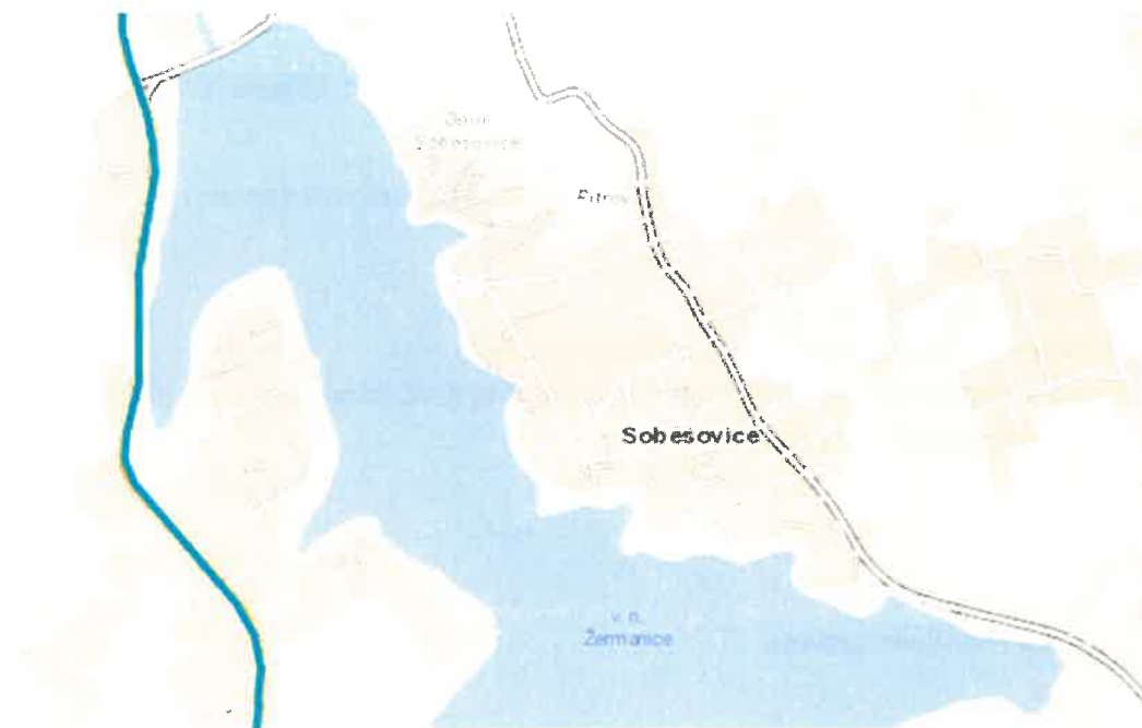
Obrázek 4 Sčítání dopravy ŘSD – obec Lučina

Zdroj: vlastní zpracování https://scitani.rsd.cz/