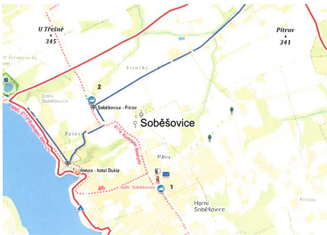
Obrázek 2 Mapa veřejných zastávek

Linky dále navazují na vlaková spojení ve městech Frýdek Místek a Havířov. Vlaková spojení z Havířova a Frýdku Místku umožňují cestování po celé ČR včetně okolních zemí. Město Havířov navíc poskytuje pohodlný spoj na ostravské mezinárodní letiště Mošnov, Ostrava airport.