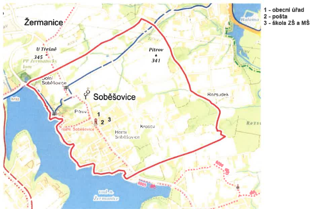
Obrázek 1 Mapa obce občanské vybavenosti

Obec disponuje veškerou občanskou vybaveností, a to obecním úřadem, základní a mateřskou školou, poštou a dalšími potřebnými službami. Veškerá tato vybavenost se nachází v centru obce. Centrum obce se z pohledu nehodovosti vyznačuje jako riziková oblast. Centrum obce je využíváno všemi obyvateli obce Soběšovice a kříží se zde místní komunikace č. 6 a silnice III/4735. Obec se tak zavázala v této lokalitě zvýšit bezpečnost pěších i všech účastníků silničního provozu.