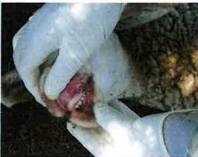
Změny v dutině ústní

V případě zjištění výše uvedených příznaků ihned kontaktujte soukromého veterinárního lékaře nebo příslušnou krajskou veterinární správu.